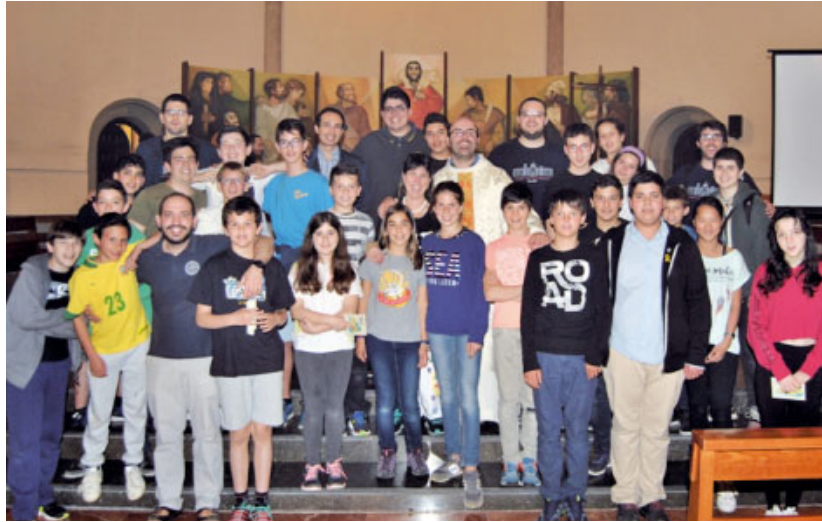
Els participants de la Diòcesi de Sant Feliu de Llobregat

Seguidament, tots els participants de la trobada es van reunir a la capella del Seminari Menor per tal de descobrir quins fruits ens emportàvem de la trobada, per posar nom al tresor més gran que compartíem, per saber quina era la clau de tot plegat i per descobrir que, en el fons, encara que no ho percebem a simple vista, Jesús sempre ens acompanya i ens dema-